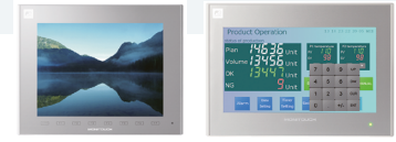
Серия Monitouch V9

Можно управлять приложением и контролировать его работу с помощью функции VPN, интегрированной в Monitouch V9.